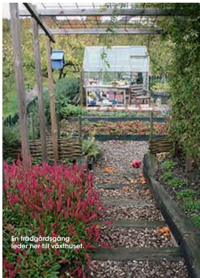
En trädgårdsgång leder ner till växthuset.

–Vi lägger mycket tid på att hitta återvunnet material. Den känsla och själ det ger till ett hus går sällan att komma i närheten av med nya material. Självkärligt blir det dyrare och tar längre tid, men dividerar man kostnaderna med antal år man har tänkt sig att huset ska stå är det helt plötsligt inte alls särskilt mycket. ■