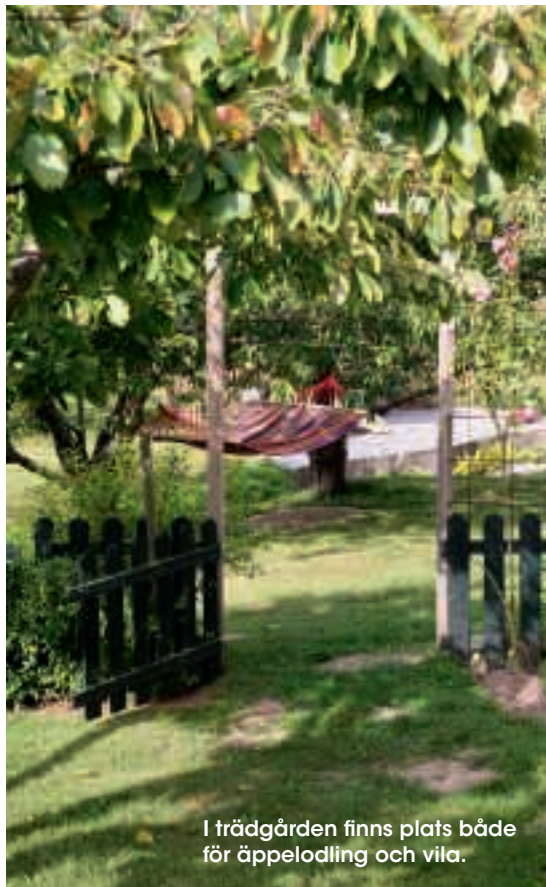
I trädgården finns plats både för äppelodling och vila.