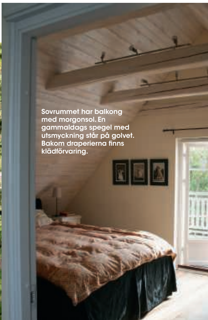
Sovrummet har balkong med morgonsol. En gammaldags spegel med utsmyckning står på golvet. Bakom draperierna finns klädförvaring.